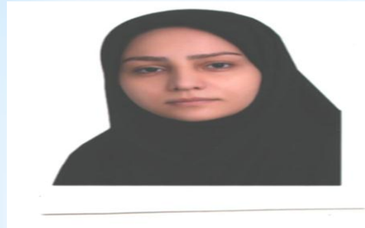
حدیث اکبری نژاد