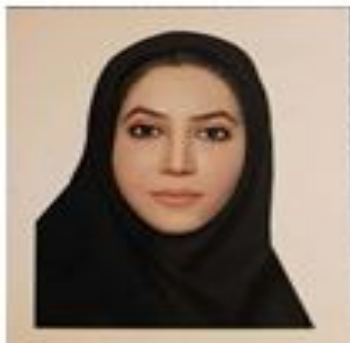
سپیرا درکه کارشناس هوشبری