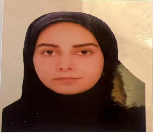
حدیث شاه حسینی