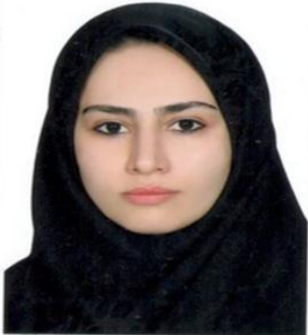
Gharb Fuka 103927